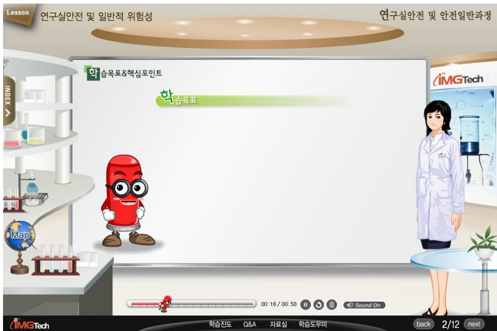
[그림 2-11] 동영상 시청