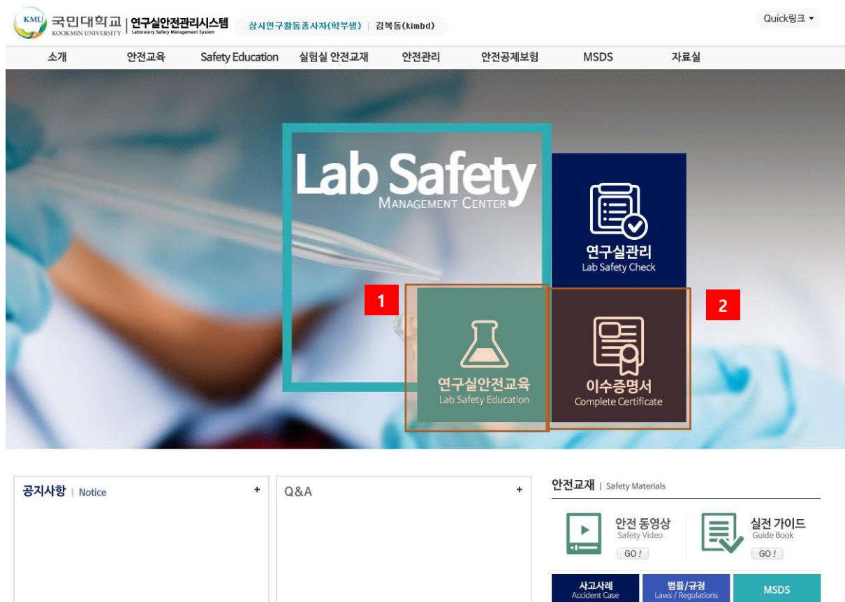
[그림 2-7] 연구실 안전관리통합시스템 홈페이지

연구활동종사자는 “연구실 안전환경 조성에 관한 법률” 제18조, 동법 시행령 제17조 및 동법 시행규칙 제9조, “산업안전보건법” 제31조(안전·보건교육)에 의거 법정 의무교육으로 안전교육을 반드시 이수하여야 한다. 연구실 안전관리통합시스템에서는 연구활동종사자의 편의를 위해 사이버 안전교육을 실시하고 있으며 연구활동종사자가 아닌 경우에는 소방안전교육을 이수해야 한다. 사이버 안전교육 수강 방법은 아래와 같다.