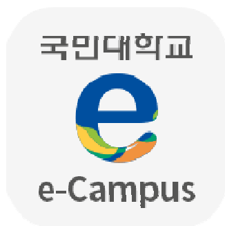
<앱 아이콘 및 스플래시 이미지>